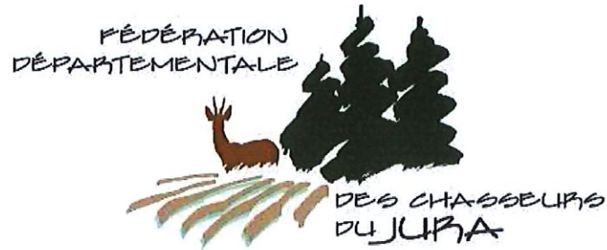
Tableau récapitulatif des décisions d'attribution de plans de chasse lièvre individuels annuels Décision n° FDC 39 2022 06 22 0017 Campagne 2022/2023

Dans le cadre des pouvoirs qui lui sont conférés par les articles L. 425 – 6 à L. 425 – 13 et R. 425 – 1 – 1 à R. 425 – 17 du code de l'environnement, le président de la fédération départementale des chasseurs du Jura a pris les décisions individuelles d'attribution de plan de chasse suivantes.